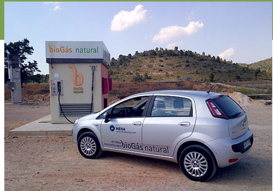
Uno de los vehículos de la flota de Grupo Hera que usa biometano como combustible.